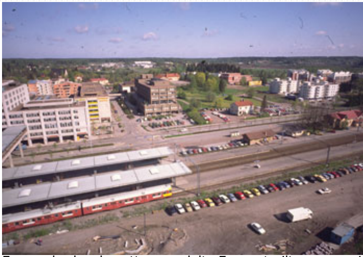
Espeen keskus kuvattuna uudelta Espoon torilta vuonna 1987 tai 1988.