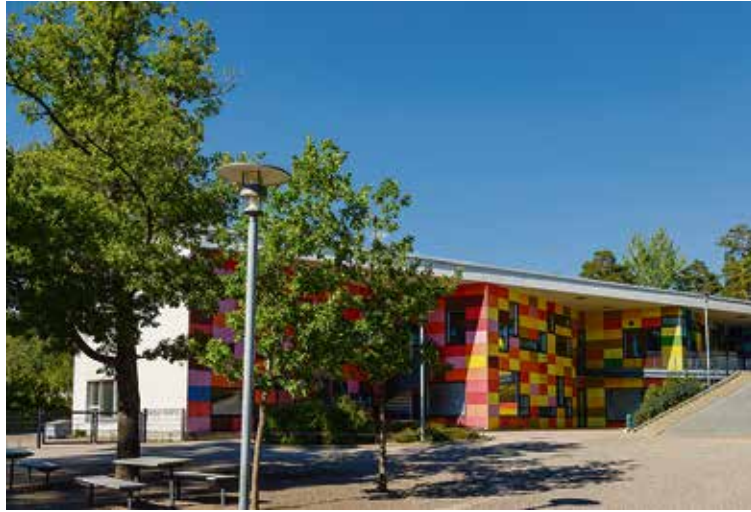
Tuomarilan päiväkoti on mukana SUNRISE Finland -tutkimuksessa

Tutkimuksen Suomen osuuteen osallistuu 1000 lasta ja heidän huoltajaansa Helsingin, Espoon, Turun, Kuopion ja Oulun kaupungeista ja näiden kaupunkien läheisistä maaseutukunnista. Laaja aineisto tuottaa uutta tietoa Suomessa asuvien lasten liikkumiskäyttäytymisestä, ja lisäksi mahdollistaa kansainvälisissä vertailuissa mukanaolon. Tutkimukseen kutsutaan mukaan 3- ja 4-vuotiaita lapsia huoltajineen tutkimukseen osallistuvien päiväkotien kautta. Espoossa tutkimus toteutetaan elo- ja marraskuun 2023 välise-