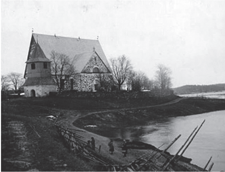
Espoon kirkko ja Espoonjoki 1900-luvun alussa.