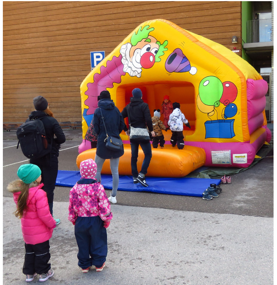
Pomppulinna on yksi Perhelystien kestopuosikeista.