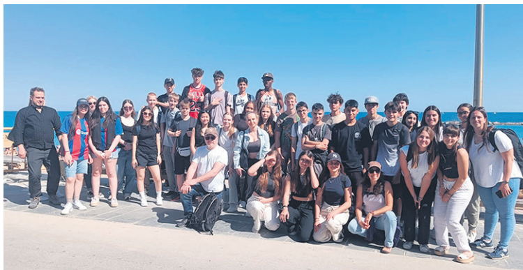
Suomalaiset ja espanjalaiset oppilaat ja opettajat.