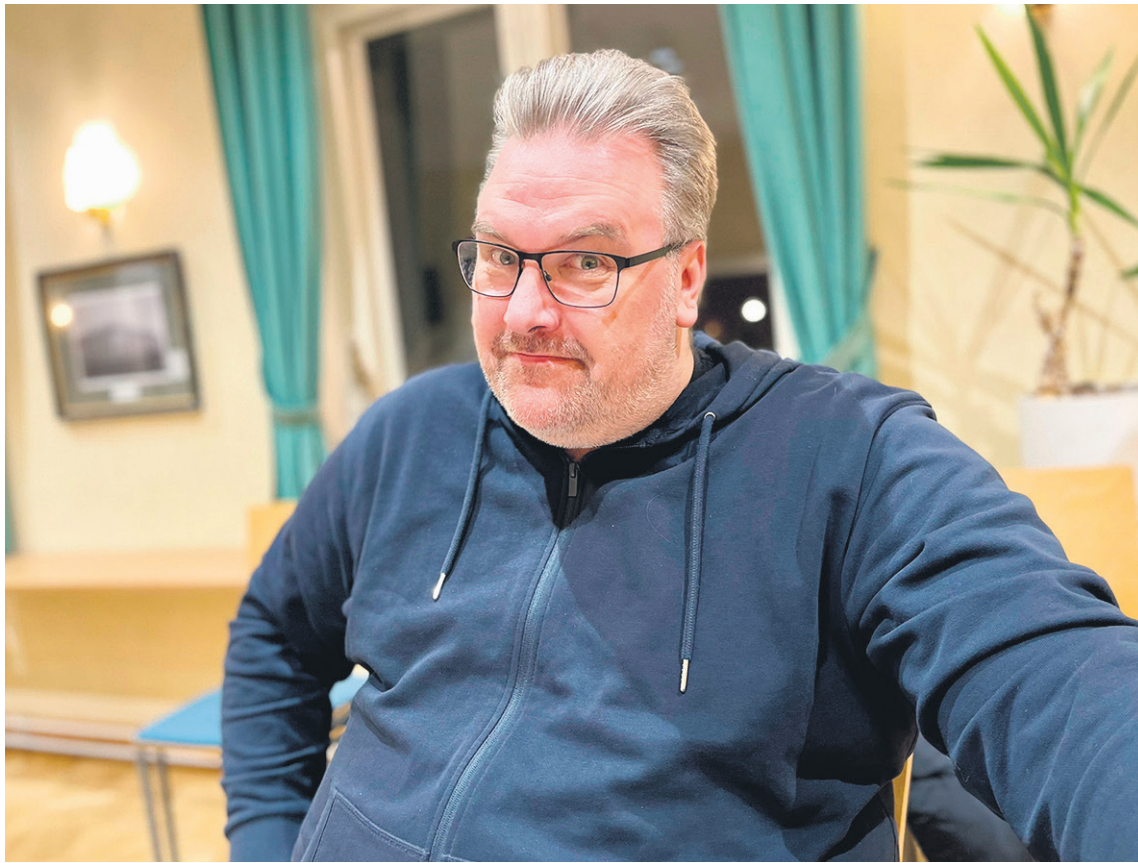
Teksti: Pirkko Sillanpää

Ville Virkkunen on pitkän uran tehnyt teatteriohjaaja ja näytelmäkirjailija. Hän muutti Tuomarilaan 2020, jossa päivän rutiineihin kuuluu aamulenkit perheen koiran Englanninspringerspanieli Ulpun kanssa. Villelle aamulenkit ovat eräänlaisia aamunavauksia, jossa saa rauhassa valmistautua tulevan päivän töihin, monesti lenkeillä suunnitellaan myös tulevia näytelmiä tai luodaan uusia runoja.