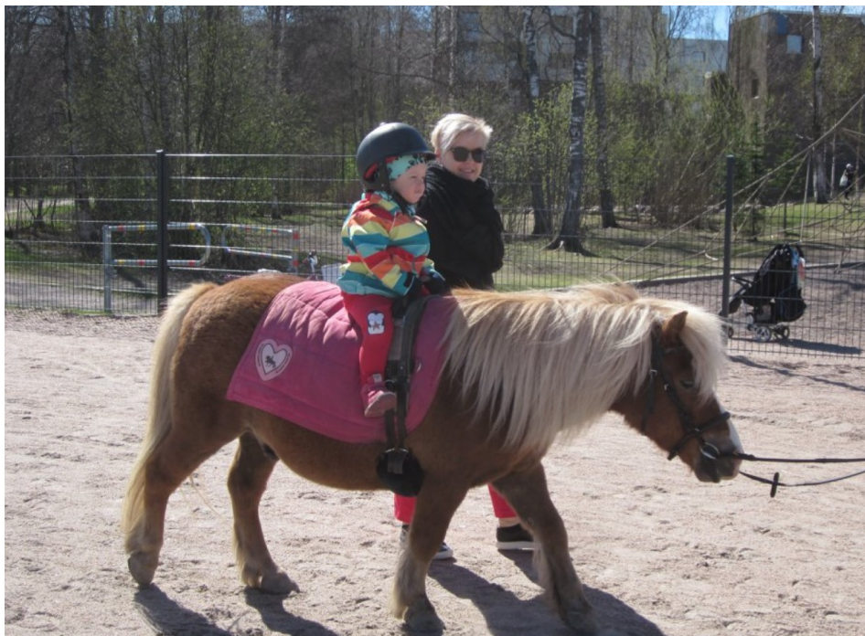
Poniratsastuksen lisäksi tapahtumassa on mahdollisuus kokeilla hevokärräajelua.

Kiinnostuitko Lions Club Espoo/Keskuksen toiminnasta? Lähetä sähköpostia: espoo.keskus@lions.fi. Lisätietoja löydät osoitteista lions.fi ja lionsespookeskus.fi.