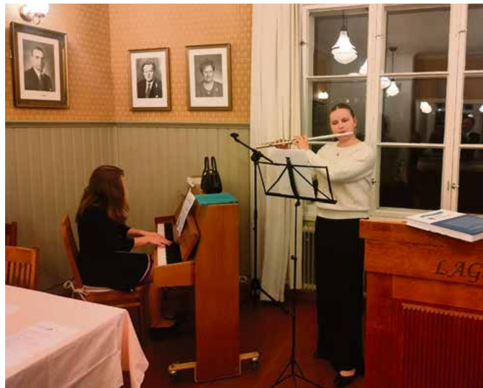
Musiikkiopisto Avonian oppilaiden musiikkiesitys