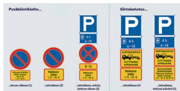
Liikennemerkit. Tällaiselta näyttävät kokeilun uudet rajoitusmerkit.

kunnossapidosta huolehtii aina kaupunginsyöhydistys.