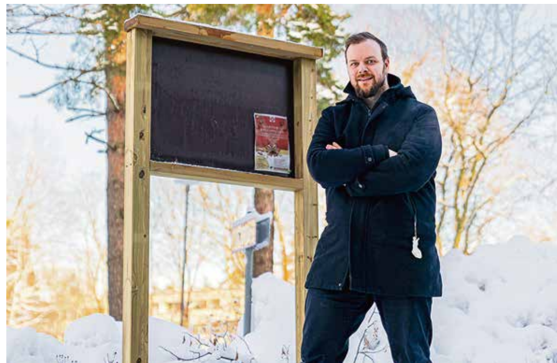
Tommi-ilmoitustaulu. Espoon kaupungin asentama uusi ilmoitustaulu Viherlaaksossa

Loppuun vielä sananen myös Espoon kaupunginvaltuustosta, jossa käsiteltiin äskettäin val-